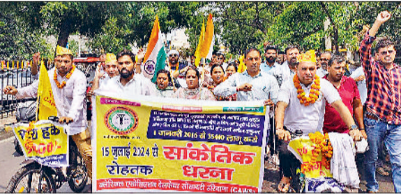
रोहतक। साइकिल यात्रा निकालते हुए लिपिक वर्ग के सदस्य।